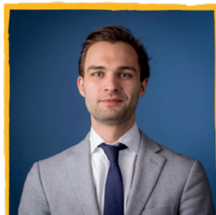
Maarten van Ooijen, Staatssecretaris

Ministerie van Volks- gezondheid, Welzijn en Sport