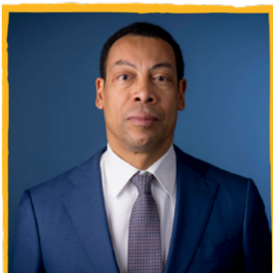
Franc Weerwind, Minister voor Rechtsbescherming