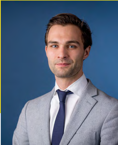
Maarten van Ooijen Staatsecretaris van Volksgezondheid, Welzijn en Sport

In dit boekje vindt u verhalen van 23 wethouders die hebben deelgenomen aan dit netwerk. Zij vertellen wat ze hebben bereikt, hun drijfveren en visie en wie hen heeft geïnspireerd. Ook geven zij tips aan collega's in andere gemeenten. Ik hoop dat hun verhalen u inspireren om net als deze wethouders aan de slag te gaan met het verbeteren van het jeugdbeleid, zodat alle jongeren gezond en veilig kunnen opgroeien.