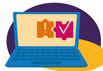
4 Melden en veiligheidsbeoordeling