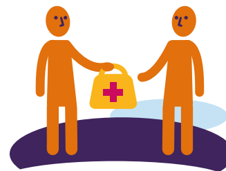
6 Begeleiding en hulp